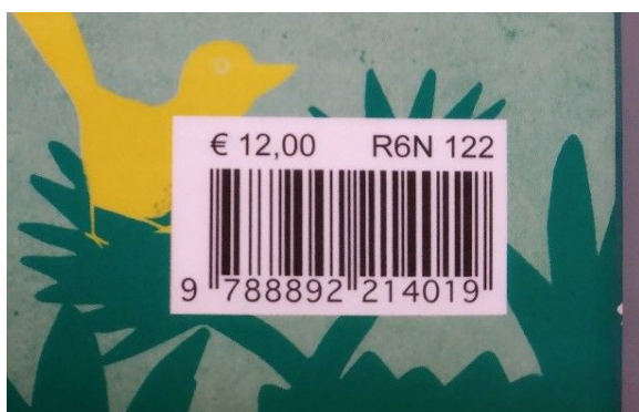
EAN da non segnalare

Esempi di ISBN e EAN su copertine libri (da considerare quando l'ISBN non si trova all'interno):